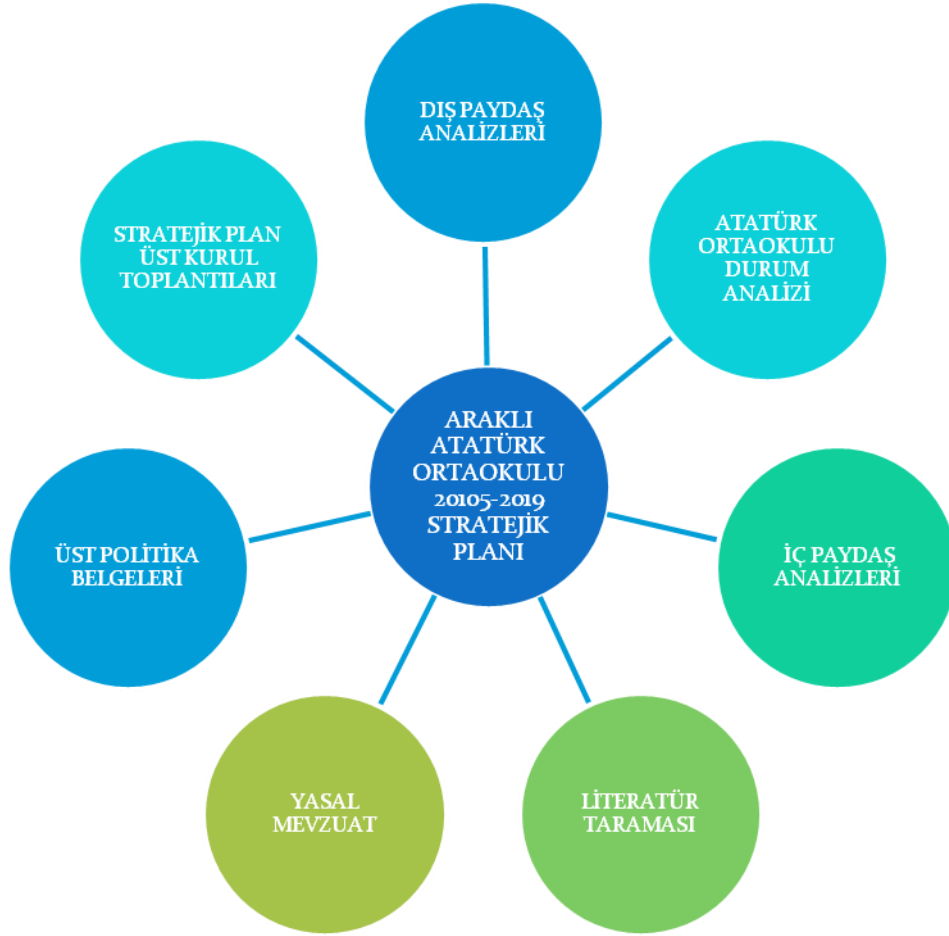
Şekil 2: Stratejik Plan Hazırlık Çalışmaları

olduğu 2013/26 sayılı Genelge ve Kalkınma Bakanlığı'nın Stratejik Planlama Kılavuzu ana çerçevesinde yürütülmüştür.